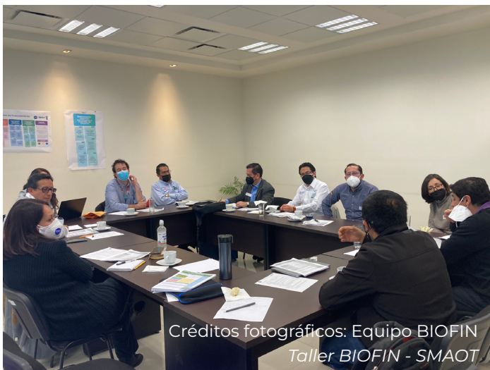
Créditos fotográficos: Equipo BIOFIN Taller BIOFIN - SMAOT

Este enfoque metodológico permitió anticipar posibles escenarios futuros y tomar decisiones informadas.